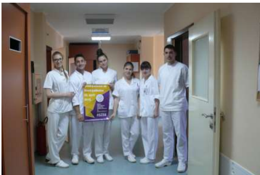
Слика 4. Ученици Медицинске школе-учесници у Пројекту „Средњошколци за средњошколце“

Наша школа се прикључила реализацији пројекта „Средњошколци за средњошколце“ који реализује Унија средњошколаца Србије (УНСС). Пројекат подразумева да средњошколци један петак у години (ове године је то био 22. април) раде у некој компанији или институцији, а послодавци за њихов рад донарају новац у Први средњошколски фонд. Из тог фонда ће се касније финансирати пројекти средњошколаца. Пројекат подржава Министарство омладине и спорта као и Министарство просвете, науке и технолошког развоја.