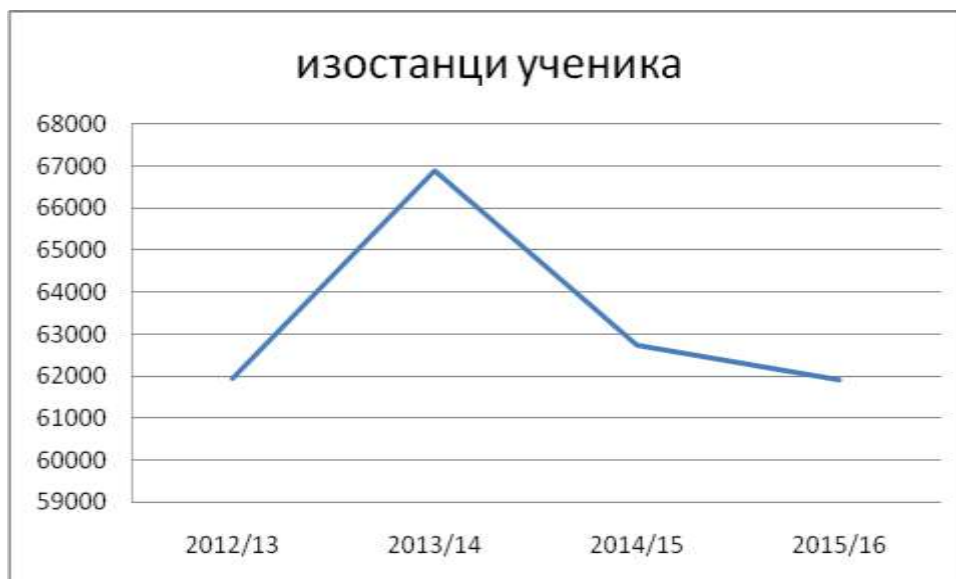
Слика 4. Укупан број изостанака ученика у последње четири године

На слици 3 је приказан укупан број изостанака ученика у последње четири школске године.