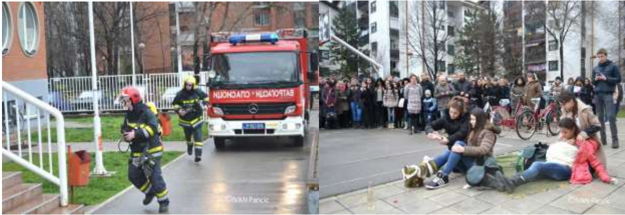
Слика 3. Реалистички приказ гашења пожара и евакуације,са пружањем прве помоћи повређеном лицу